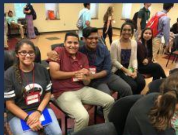
Los participantes disfrutaron asistiendo a las presentaciones.