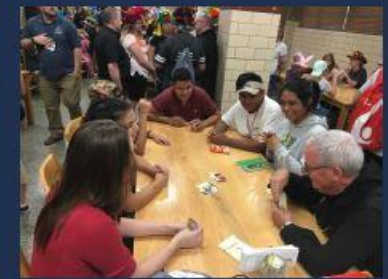
Los participantes disfrutaron jugando UNO con el Abad.