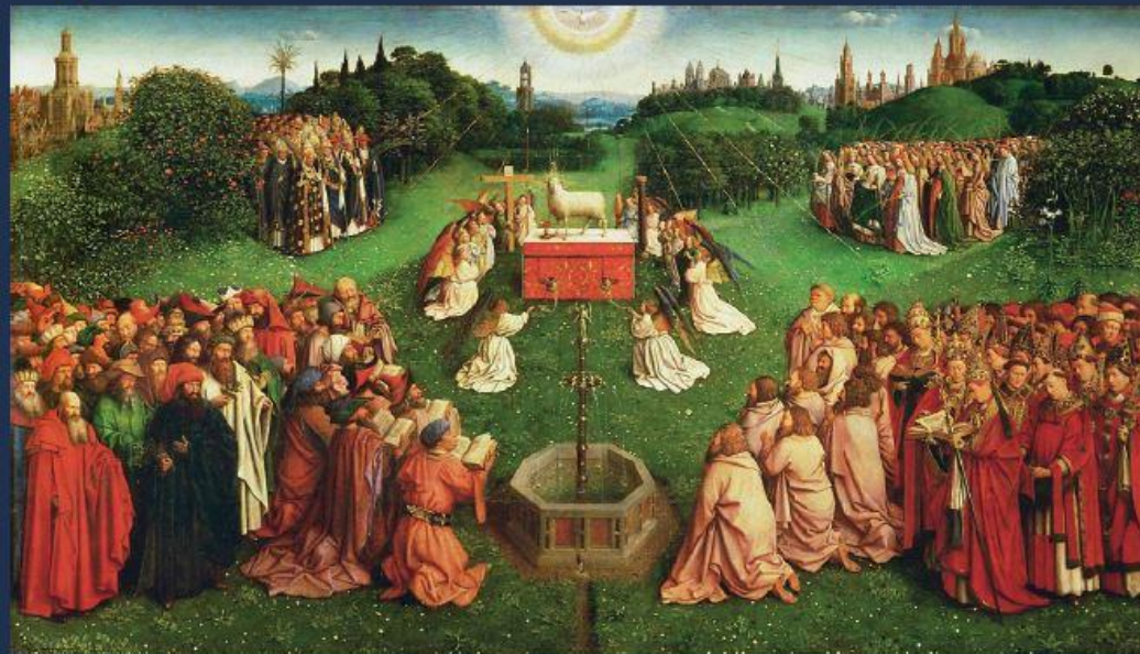
Jan Van Eyck, El Retablo Ghent: Adoración del Cordero , 1432, óleo sobre tabla