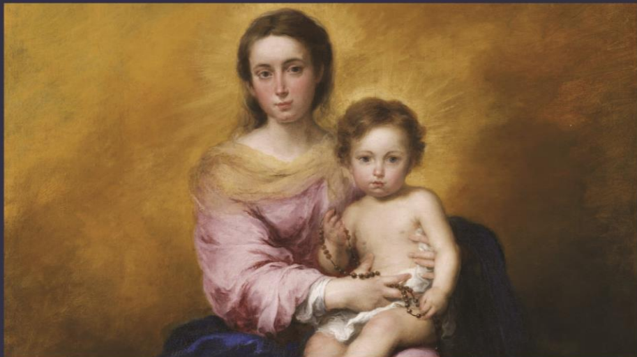
Bartolomé Esteban Murillo, La Virgen del Rosario , 1675-80, óleo sobre lienzo