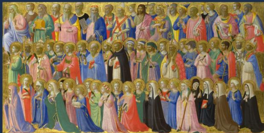
Fra Angelico, Los Precursores de Cristo con Santos y Mártires , 1423-24, tempera en madera